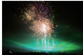
『油谷 楊貴妃伝説』