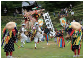
『楽踊り虎の子渡し』