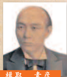
楢取 素彦 吉田松陰の「松下村塾」を託され、長州藩主 毛利敬親の側近として幕末から維新を駆ける。また、初代群馬県知事。