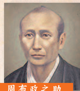
周布政之助 幼少時に三隅で育つ。村田清風とは親戚関係。幕末、長州藩志士のよき理解者。禁門の変後、自刃。

主催 「楢取素彦と妻・寿」企画展実行委員会 問い合わせ・申し込み先 長門市役所 観光課 ☎0837-23-1137