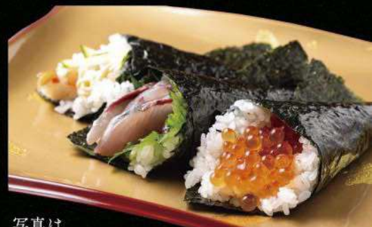
写真は えびきゅう/あじ/いくらです。