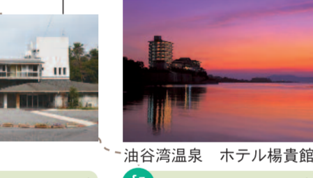
油谷湾温泉 ホテル楊貴館