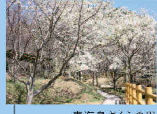
青海島さくらの里