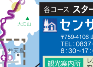
各コース スタート&ゴール センザキッチン