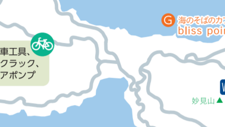
海のそばのカフェ bliss point