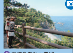
青海島自然研究路 (メモリアルロード)