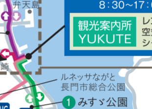
ビギナーコース 三隅芸術サイクリング