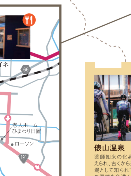
仙崎まちなかサイクリング