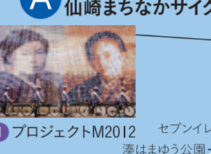
ビギナーコース 仙崎まちなかサイクリング