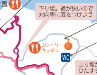
下り坂。道が狭いので 対向車に気をつけよう