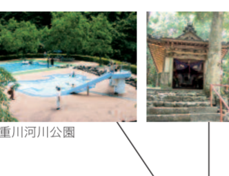
ユウカリとタイヨウ

白猿の湯 住所/長門市俵山5172 時間/7:00~21:00 ◎19:00~21:00 タイムサービスあり 料金/大人850円、小学生620円、幼児370円 定休日/なし ※メンテナンス等で臨時休業あり