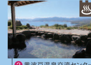
黄波戸温泉交流センター