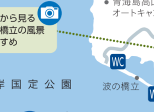
大日比 ナツミカン 原樹