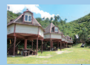
青海島ミニビジターセンター 青海島キャンプ村