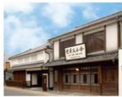
金子みすゞ記念館

広大な日本海を背に連なる123基の赤い鳥居が印象的。高台にある大鳥居の上部、高さ約5mの位置には賽銭箱が設置されており、投げ入れることができれば願い事が叶うと言われてます。