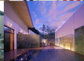
油谷湾温泉 ホテル楊貴館