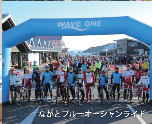
ながとブルーオーシャンライド