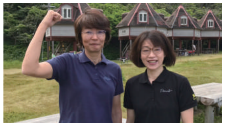
臨時職員（キャンプ村）