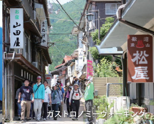
ガストロノミーウォーキング