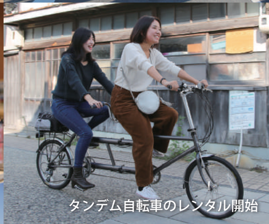
タンDEM自転車のレンタル開始