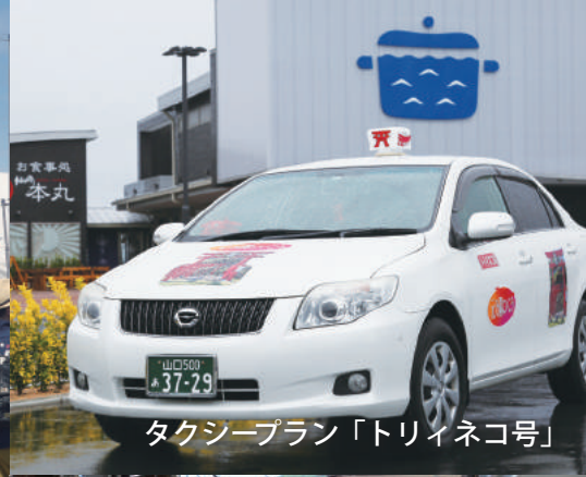
タクシープラン「トリイネコ号」