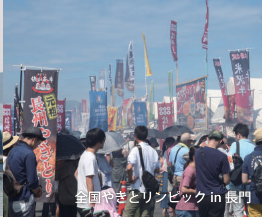
全国やきとリンピック in 長門