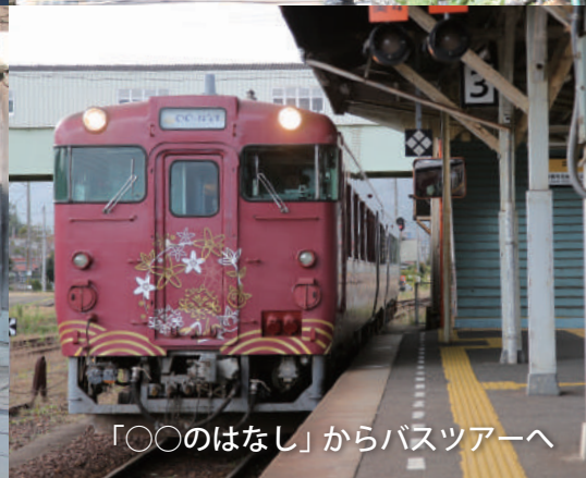
「〇〇のはなし」からバスツアーへ