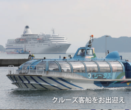
クルーズ客船をお出迎え