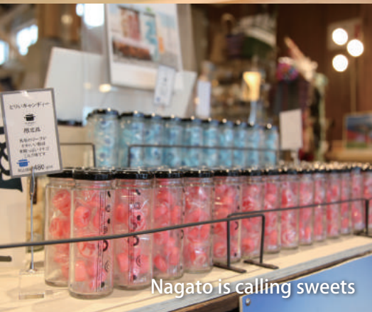
Nagato is calling sweets