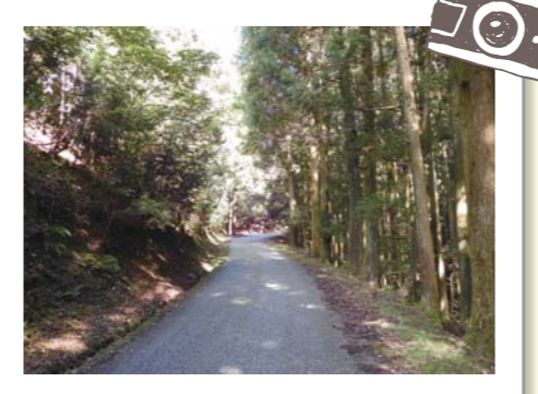
杉木立続く福王子線