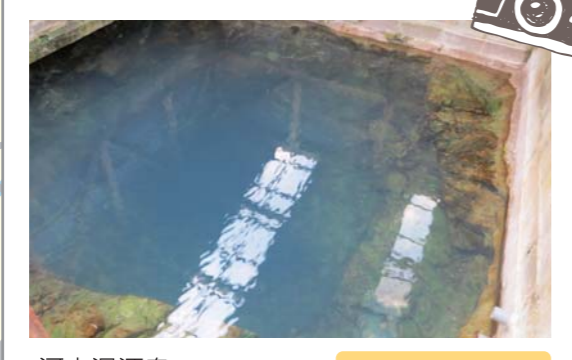
河内湯源泉 温泉閣から100m