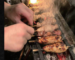
やき鳥歩ム 自由が丘