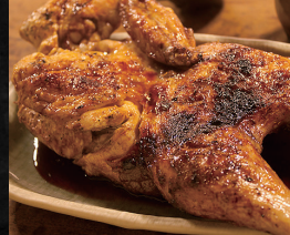
焼鳥専門ぎんねこ