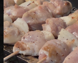
鶏・豚串焼き とり輔