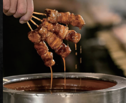
やきとりの一平本店