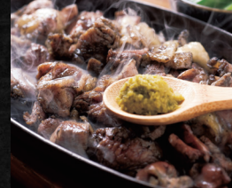
みやざき地頭鶏専門店ぐんけい