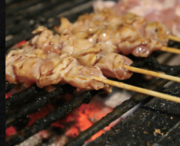
焼鳥とジンギスカン 北の大地