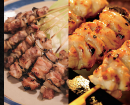
長門やきとり横丁連絡協議会