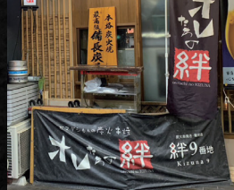
炭火串焼オレたちの絆