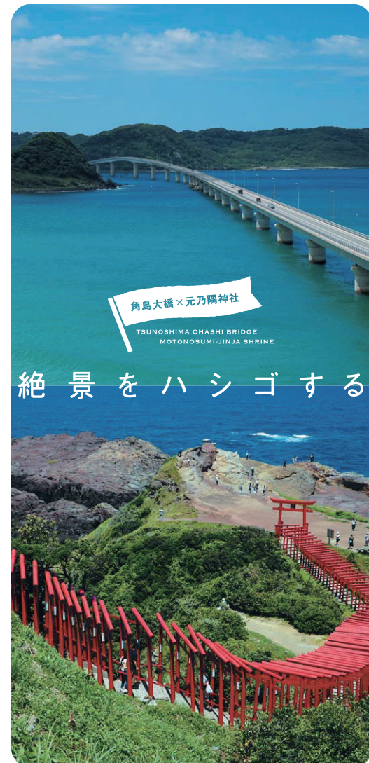
角島大橋 × 元乃隅神社