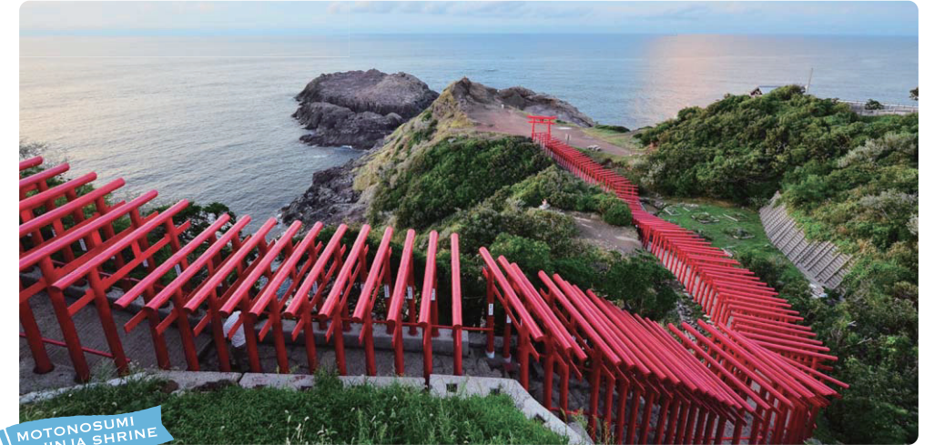
MOTONOSUMI JINJA SHRINE