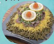
焼茶そばと具の絶妙なハーモニー